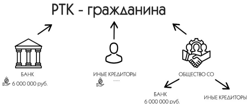
Рис. 1. РТК гражданина в случае установления субсидиарного требования

Требования банка включены в РТК гражданина как поручителя по кредитному договору + требования банка через механизм привлечения КДЛ к субсидиарной ответственности также будут включены в РТК гражданина на эту же сумму.