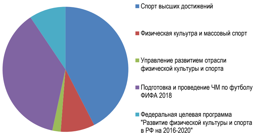
Рис. 1. Расходы федерального бюджета на развитие физической культуры и спорта в 2018 году 3

же реализуется бюджет в сфере физической культуры и спорта? Исходя из отчета о ходе реализации государственной программы Российской Федерации "Развитие физической культуры и спорта" за 2018 год было потрачено 72 миллиарда рублей.