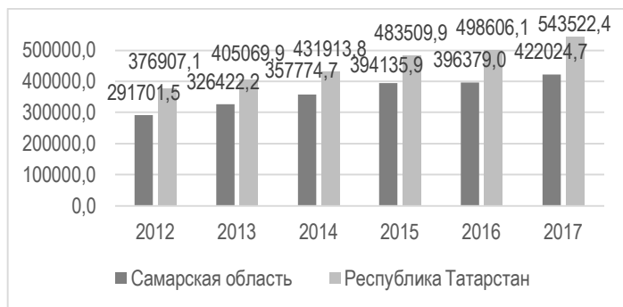
Рис. 3. Динамика объема ВРП на душу населения в Самарской области и Республике Татарстан за 2012-2017, руб.

Необходимо также сравнить такой показатель как ВРП на душу населения, динамика которого представлена на рис. 3.