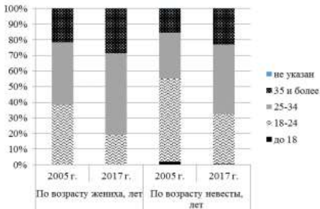
Рис. 3. Структура браков по возрастам жениха и невесты, %

Обратимся к сравнению структуры браков по возрасту жениха и невесты в 2005 году и 2017 году. Результат сравнительного анализа представлен на рисунке 3.