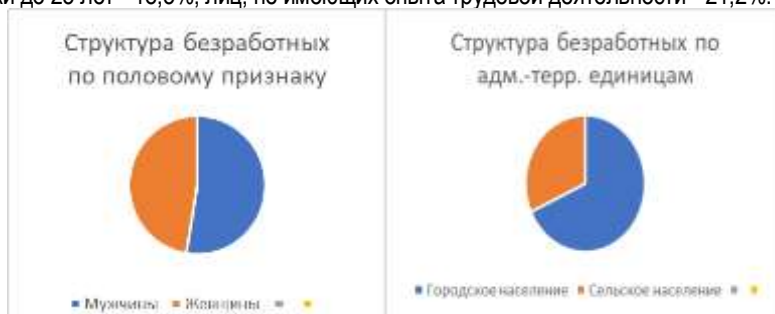
Рис. 2. Структура безработных по половому признаку и по адм.-терр. единицам

Исследуя безработицу по половому и пространственному аспектам, авторы получили следующие данные: по оперативным данным Росстата на январь 2020 г. среди безработных в возрасте 15 лет и старше доля женщин составила 47,4%, городских жителей - 68,2%, молодежи до 25 лет - 18,5%, лиц, не имеющих опыта трудовой деятельности - 21,2%.